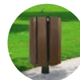
Corbeille BOTANIA p.107