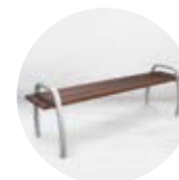
Banc INTERLUDE p.39