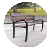
Banc CONFIDENCE p.40-41