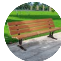
Banc ONIS p.46