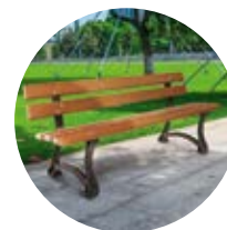
Banc RENDEZ-VOUS p.46