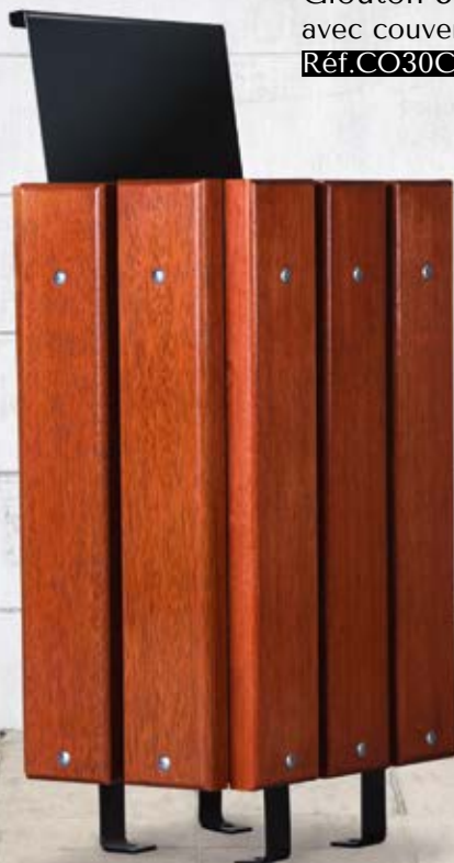
Glouton 30 L avec couvercle Réf.CO30C